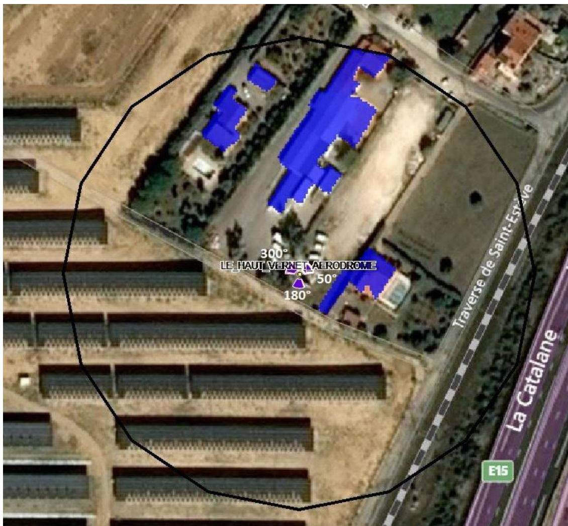
Fond de carte (photo aérienne), source : bing. Logiciel de simulation Cellerity, éditeur Orange Labs

À 1,5 m du sol, le niveau maximal simulé en intérieur pour les antennes à faisceau fixe est compris entre 0 et 1 V/m.