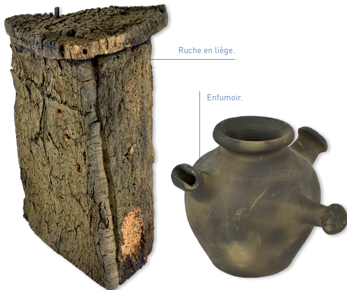
Ruche en liège.

Le musée est situé au cœur de la villa Les Tilleuls. Conçue par l'architecte Viggo Dorph-Petersen au début du XX e siècle, c'est un écrin botanique et architectural de style Art nouveau qui se découvre dans le quartier de la gare de Perpignan.