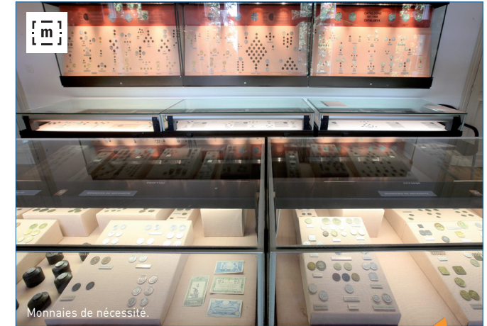
Monnaies de nécessité.

Situé dans l'hôtel particulier Çagarriga dont la construction remonte au XVI e siècle, le muséum propose tout au long de l'année des expositions temporaires et des activités pédagogiques qui en font un lieu de découverte pour tous.