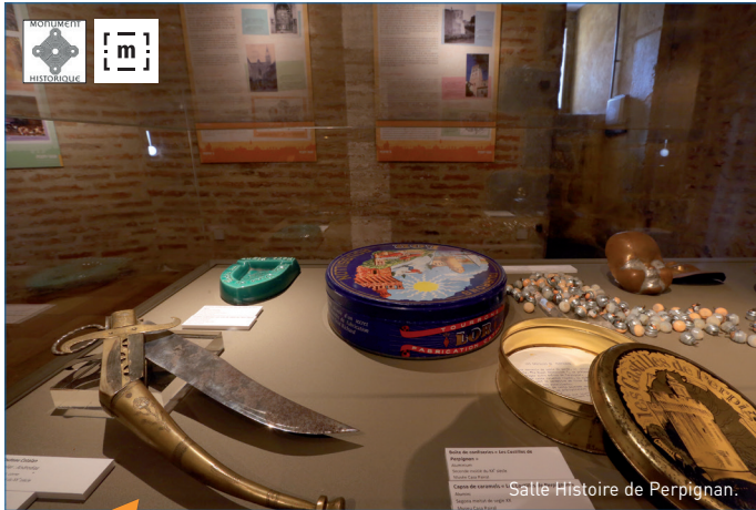
Salle Histoire de Perpignan.