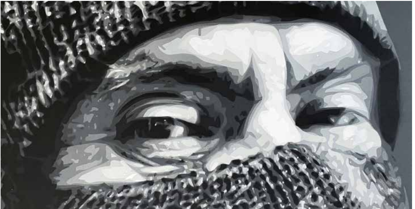
Capucha. Pochoirs et bombes, 62 x 93 cm.

« J'ai choisi de signer mes œuvres NO NAME STENCIL.