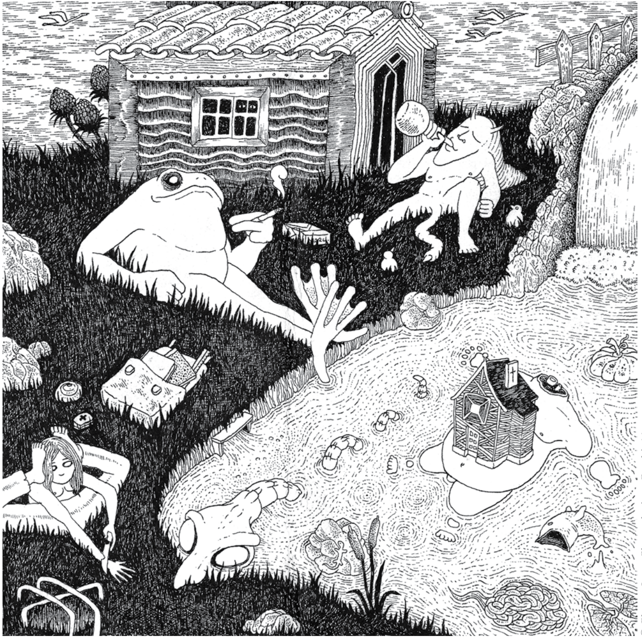
Les bucoliques , encre de chine sur papier, 21 x 15 cm.