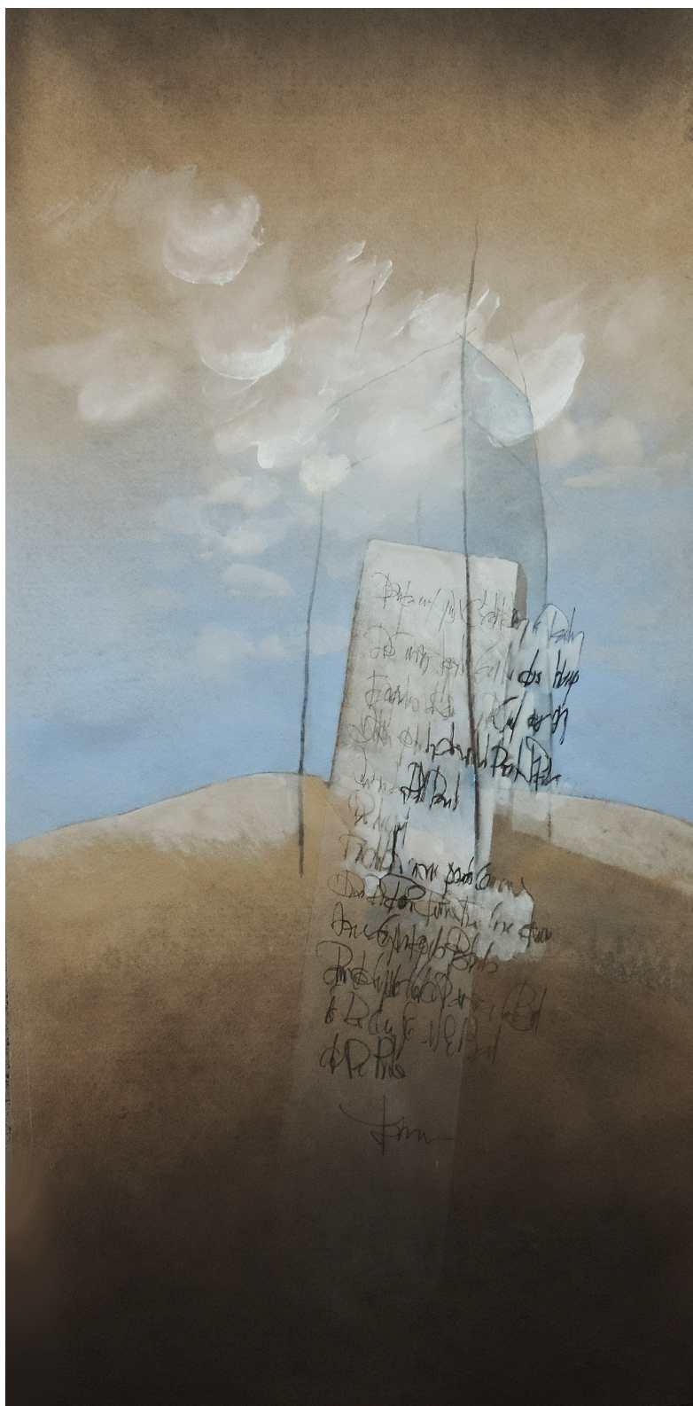
Illisible , acrylique sur toile géotextile, 220 cm x 100 cm.