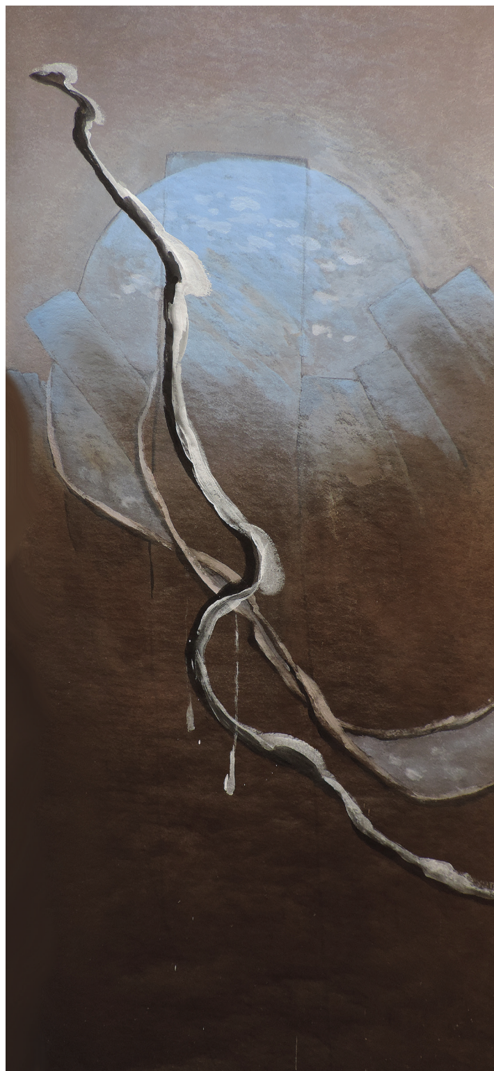
Abordage aux frontières du connu et de l'inconnu, acrylique sur toile géotextile, 190 cm x 100 cm.